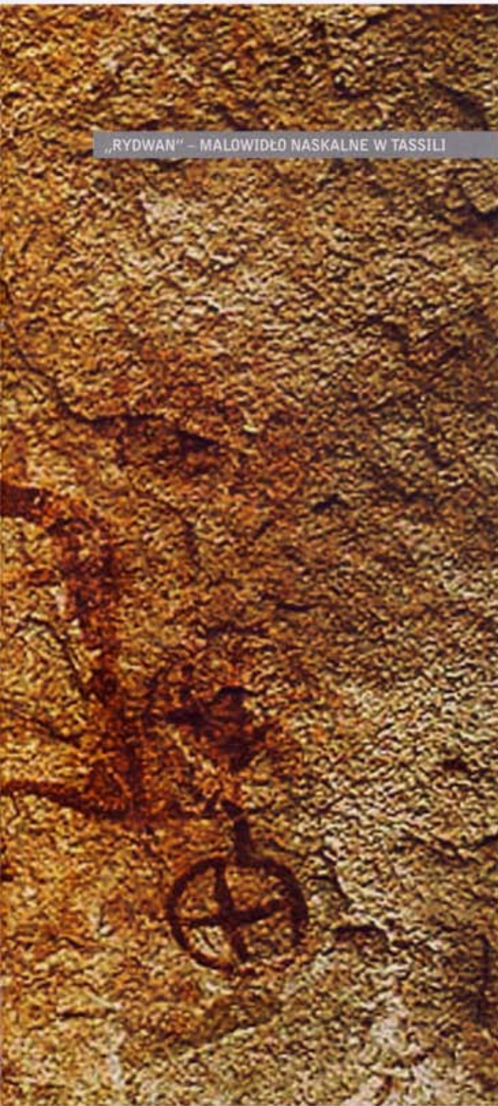
„RYDWAN” – MALOWIDŁO NASKALNE W TASSILI

Tassili-n-Ajjer to nazwa dobrze znana każdemu badaczowi pradziejowej sztuki naskalnej. Oznacza ona rozległy płaskowyż piaskowcowy, położony w południowo-wschodniej części Algierii tuż przy granicy z Libią. Jest to zarazem największe w skali światowej – zarówno pod względem obszaru, jak i bogactwa – skupisko pradziejowych i wczesnohistorycznych malowideł i rytów. Wykonywano je przez kilka tysięcy lat, prawdopodobnie już od końca plejstocenu (pierwsze ryte przedstawienia wielkich zwierząt łownych) aż do czasów nowożytnych (schematyczne malowidła związane z problematyką karawan wielbłądów).