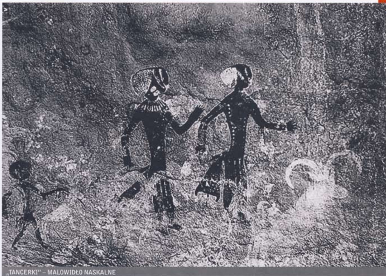
„TANCERKI” – MALOWIDŁO NASKALNE

najcenniejszych w całym Tassili. Ogółem zespół polski zinwentaryzował ok. 20 zespołów sztuki i ok. 20 stanowisk archeologicznych oraz wykonał całość dokumentacji fotograficznej i topograficznej dla wszystkich (ok. 50) obiektów sztuki, opracowanych przez ekspedycję. Po powrocie do Algieru, polscy badacze wykonali całość dokumentacji w jęz. francuskim oraz opracowali projekt katalogu obiektów obu kategorii opartego na kartach perforowanych wraz z odpowiednim kodem numerycznym. Po wprowadzeniu do pierwotnego systemu inwentaryzacji koniecznych korekt, wynikłych z praktycznych doświadczeń terenowych, opracowano i powielono tymczasowe sprawozdanie z powyższych badań, mające jednocześnie charakter podręcznika metodycznego do problematyki inwentaryzacji sztuki naskalnej.