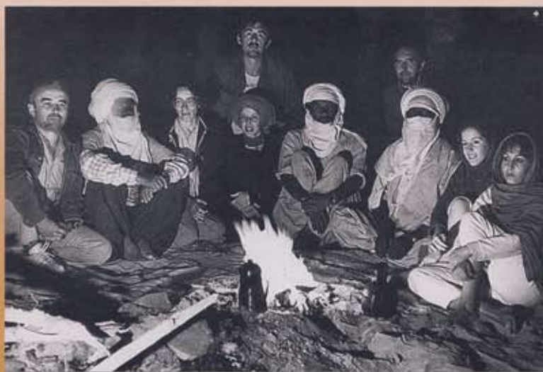
UCZESTNICY EKSPEDYCYJ PRZY WIECZORNYM OGNISKU

między ówczesną Polską Rzeczpospolitą Ludową i Algierską Republiką Ludowo-Demokratyczną z lat 1980-1981. Po zgłoszeniu przez Muzeum Archeologiczne w Poznaniu gotowości podjęcia takiej współpracy, przeprowadzono wspólnie ze stroną algierską dwie kampanie badawcze (XI/XII 1980 r. i X/XI 1981 r.)