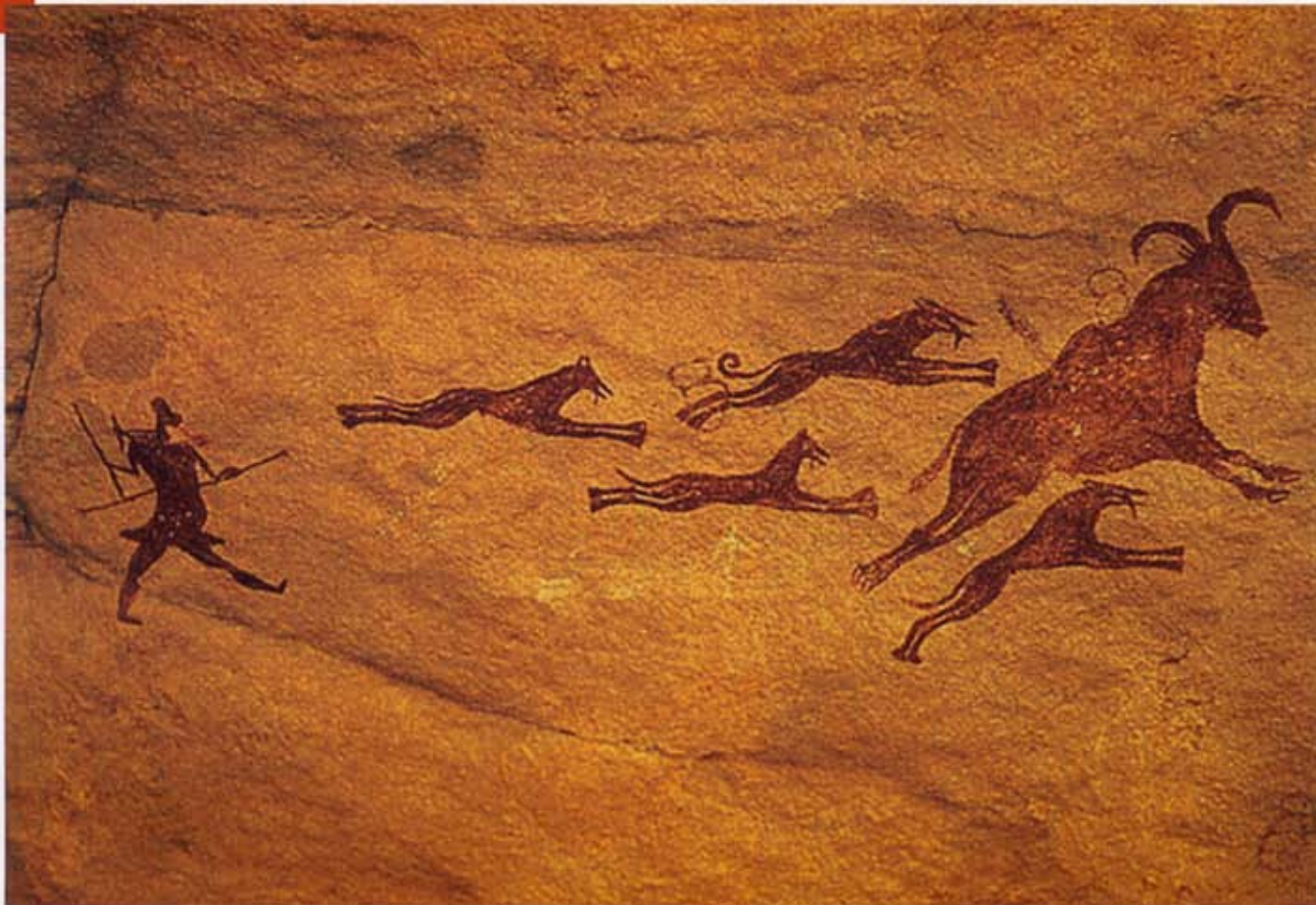
„POLOWANIE” – MALOWIDŁO NASKALNE

między ówczesną Polską Rzeczpospolitą Ludową i Algierską Republiką Ludowo-Demokratyczną z lat 1980-1981. Po zgłoszeniu przez Muzeum Archeologiczne w Poznaniu gotowości podjęcia takiej współpracy, przeprowadzono wspólnie ze stroną algierską dwie kampanie badawcze (XI/XII 1980 r. i X/XI 1981 r.)