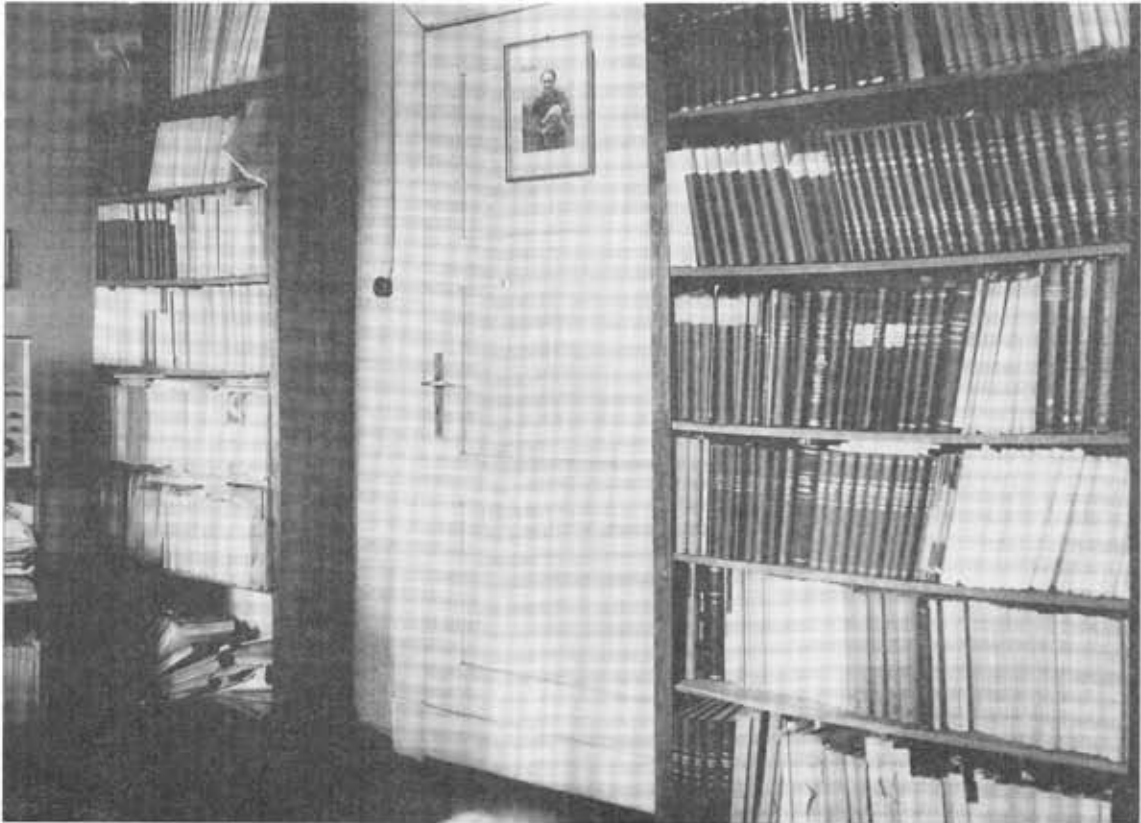
Ryc. 5. Gabinet prof. Józefa Kostrzewskiego w Strzeszynie (październik 1969). Archiwum Muzeum Archeologicznego w Poznaniu, nr inw. 21237