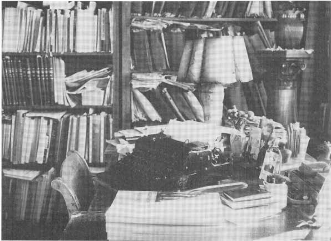
Ryc. 4. Gabinet prof. Józefa Kostrzewskiego w Strzeszynie (październik 1969). Archiwum Muzeum Archeologicznego w Poznaniu, nr inw. 21236